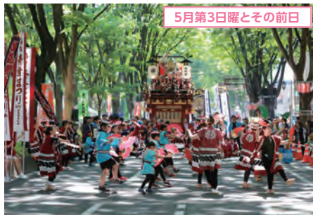
5月第3日曜とその前日

第73回東北鞍馬競技大会(涌谷町) 自馬の力を競うことを目的とした歴史ある大会。最大975kgの重量をのせたソリを引き、人馬一体となった競技に観衆からは大きな歓声と拍手が起こる。