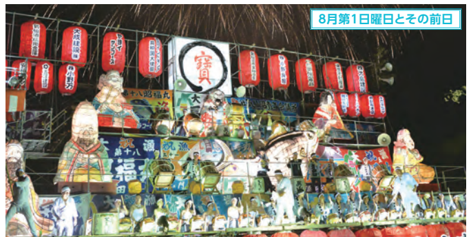
8月第1日曜日とその前日

JR小牛田駅東口のロータリーで開催される鉄道イベント。当日は車両展示やミニSLの運行、レールスター試乗など「鉄道の町」ならではの魅力が詰まった内容となっている。