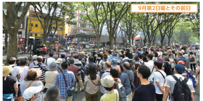
定禅寺ストリートジャズフェスティバル(仙台市) 社の都・仙台を代表する恒例の音楽フェスティバル。国内はもとより海外からもプロ・アマのアーティストが参加し、仙台市内をステージに熱い演奏が繰り広げられる。(写真は2019年の様子)