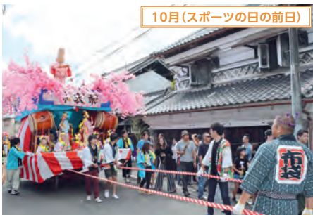
10月(スポーツの日の前日)