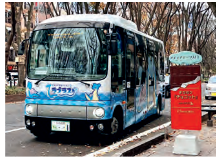
©2023 Pokémon ©1995-2023 Nintendo/Creatures Inc./GAME FREAK inc. ポケットモンスター・ポケモン・Pokémonは任天堂・フリーチャーズ・ゲームフリークの登録商標です。

仙台市中心部の買い物や日常生活でちょこっと乗れる仙台部心循環バス「まちなり「チョコット」withラプラス」。みやぎ応援ポケモン「ラプラス」がデザインされたラッピング車両で運行中。運行経路は、仙台駅前3番乗り場、ハピナ名掛丁入口、本町二丁目、錦町公園前、定禅寺通市役所前、メディアテーク入口、東北公済病院・戦災復興記念館前、晩翠草堂前、青葉通一番町駅、あおば通駅、仙台駅(降車場)。