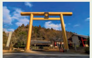
黄金山産金遺跡(涌谷町)