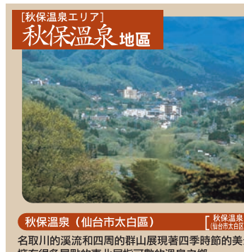
【秋保温泉エリア】 秋保温泉地區 名取川的溪流和四周的群山展現著四季時節的美景，擁有很多景點的東北屈指可數的溫泉之鄉。