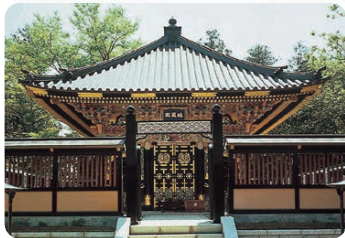
瑞鳳殿(仙台市青葉區) 【瑞鳳殿(仙台市青葉區)】 伊達政宗的靈堂，由第2代藩主忠宗於寬永14(1637)年建立。作為絢爛豪華的桃山風格的寺廟建築被指定為國寶，但是因戰禍燒毀。現在的建築物是完全按照當時的樣子重建而成的。