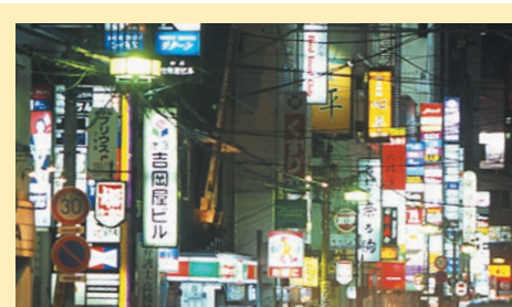
國分町 【国分町】 國分町是聚集了3000多家飲食店的東北最大的霓虹燈街。沿著道路林立著飲食店樓，週末的夜晚因公司職員等大量的客人匯聚而熱鬧擁擠。