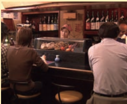
牛舌【牛たん】 起源於仙台的美味。新鮮舌肉以它的鮮美和醇香，獨特的風味吸引著客人。烤牛舌、麥飯、牛尾湯的套餐是推薦項目。