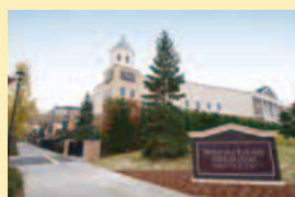
【仙台泉プレミアム・アウトレット(仙台市泉區)】 仙台泉豪華奥特莱斯(仙台市泉區) 在模仿美國東北部街區風格而修建的建築群裡，80多間高級奢侈品牌店和各式日雜物品店鱗次櫛比。與相鄰的“泉商業城塔皮奧Tapio”合起來共有160多家店鋪構成了泉區的購物景點。