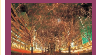
【SENDIのページェント(仙台市青葉區)】 仙台火樹銀花節(仙台市青葉區) 12月上旬-31日的17點30分-23點(只有31日是到24點)，裝飾在定禪寺路和青葉路的櫻樹上的燈飾點綴著仙台的夜空。在18點、19點、20點分3次熄燈約1分鐘後再一齊點燈似星光流瀉，穿著聖誕老人的裝束進行遊行的聖誕老人森林的故事等，舉行很多活動。