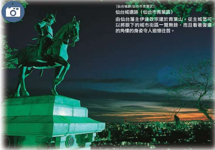
【仙台城跡(仙台市青葉區)】 仙台城遺跡(仙台市青葉區) 由仙台藩主伊達政宗建於青葉山。從主城堡可以將眼下的城市街區一覽無餘，而且看著復建的角樓的身姿令人追憶往昔。

自伊達政宗建城以來已有400年。作為關東以北最大的城下町而繁榮昌盛的古城，也是充分利用青葉山和廣瀨川的自然條件，有著櫻樹、銀杏樹林蔭道的“森林之都”。可以在清新的空氣之中暢遊歷史古蹟，或買連東西南北的購物中心。