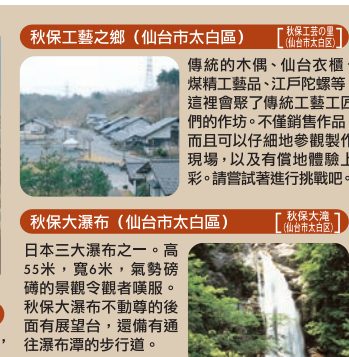
秋保工藝之鄉(仙台市太白區) 【秋保工藝之郷(仙台市太白區)】 傳統木偶、仙台衣櫃、煤精工藝品、江戸陀螺等，這裡會聚了傳統工藝匠人們的作坊。不僅銷售作品，而且可以仔細地參觀製作現場，以及有償地體驗上色。請嘗試進行挑戰吧。 秋保大瀑布(仙台市太白區) 【秋保大滝(仙台市太白區)】 日本三大瀑布之一。高55米，寬6米，氣勢磅礴的景觀令觀者嘆服。秋保大瀑布不動尊的後面有展望台，還備有通往瀑布的步行道。