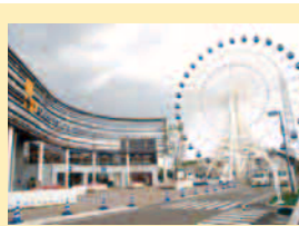
【三井アウトレットパーク仙台港(仙台市宮城野區)】 三井奥特莱斯仙台港(仙台市宮城野區) 東北最大規模的奥特莱斯，這裡匯集著120多家商店和餐廳。同時還有可以享受各式美味的美食廣場，以及高達50米的摩天輪遊覽車。是一處可以享受一整天的家族購物設施。