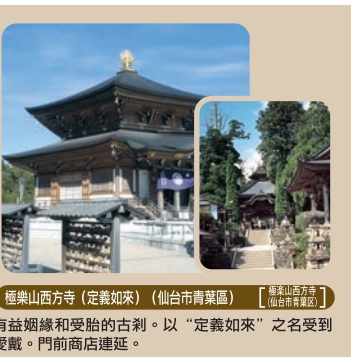
【作並温泉】 作並溫泉(仙台市青葉區) 經樂山西方寺(定業如來)(仙台市青葉區) 【經樂山西方寺(定業如來)(仙台市青葉區)】 有益姻緣和受孕的古刹。以“定業如來”之名受到愛戴。門前商店連延。