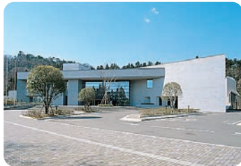
仙台市博物館(仙台市青葉區) 【仙台市博物館(仙台市青葉區)】 收藏了伊達家捐贈的文化財產以及關於仙台的資料約9萬件。國寶“慶長遠歌使節關係資料”和重要文化財產伊達政宗的鎧甲是必看項目。(需要確認展示期間)