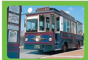
Loople仙台(仙台市青葉區) 【Loople仙台(仙台市青葉區)】 每隔15-20分鐘從仙台站發車的觀光環路公共汽車。可以高效率地周遊博物館、仙台城遺跡等市內中心部的觀光景點。○1次車票/大人:260日元，未滿12歲的兒童:130日元(1日遊車票/大人:620日元，未滿12歲的兒童:310日元)