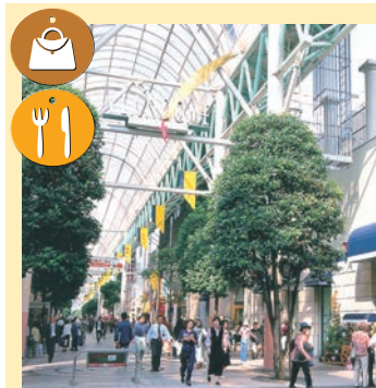
Vlandome 一番町 【ブランドーム一番町】 仙台站內S-PAL 【仙台站S-PAL(仙台市青葉區)】 購物街(仙台市青葉區) 從仙台站到一番町、從定禪寺路到南町路是由6個拱廊構成的大型購物區。並且在車站周圍開設了大型家電商場，一派繁華景象。