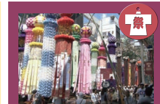
【仙台七夕まつり(仙台市青葉區)】 仙台七夕節(仙台市青葉區) 是從伊達政宗時代起延續至今的傳統活動。被列為東北三大節日之一。在中心部的拱廊街以及周圍的商店街上，大小共有約3000個七夕裝飾在風中搖曳。前一天晚上的七夕煙花大會因眾多的觀客而熱鬧非凡。在每年的8月6日-8日舉辦(預慶活動為5日)。