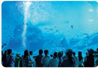
仙台海之都水族館(仙台市宮城野區) 【仙台海之都水族館(仙台市宮城野區)】 於2015年7月開始營業。水族館內有以表現東北三陸的大海為主題的大型水槽和以廣瀨川的優美環境為主題的展示，有海豚和海獅的精美表演，還可以體驗與企鵝友好互動等充滿魅力的遊覽項目。一樓還設置了美食廣場。