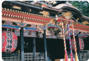
大崎八幡宮(仙台市青葉區) 【大崎八幡宮(仙台市青葉區)】 據說是仙台藩始祖伊達政宗在位於仙台的乾(西北)方向的該地所建。社殿可以看出豪華絢爛的桃山建築的特色，向後人展示了當年伊達家之威風。每年1月14日舉辦的松焚節因眾多的參拜者而熱鬧非凡，人們來這裡祈禱無病息災、生意興隆。