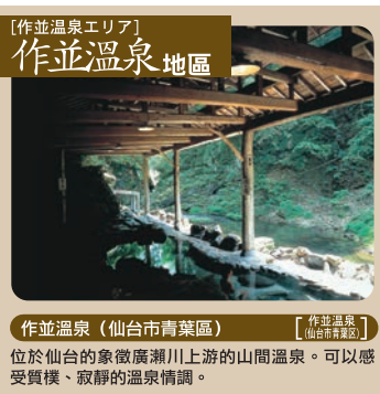
【作並温泉エリア】 作並温泉地區 位於仙台的象徵廣瀨川上游的山間溫泉。可以感受質樸、寂靜的溫泉情調。