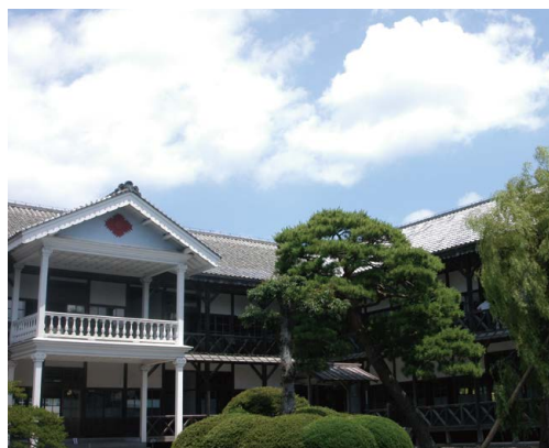
教育資料館(旧登米高等尋常小学校)