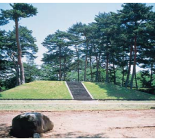
特別史跡 多賀城廃寺跡