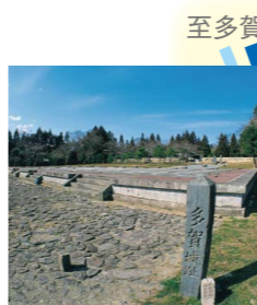
特別史跡 多賀城跡