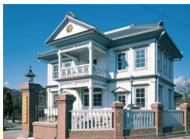
警察資料館(旧登米警察署)