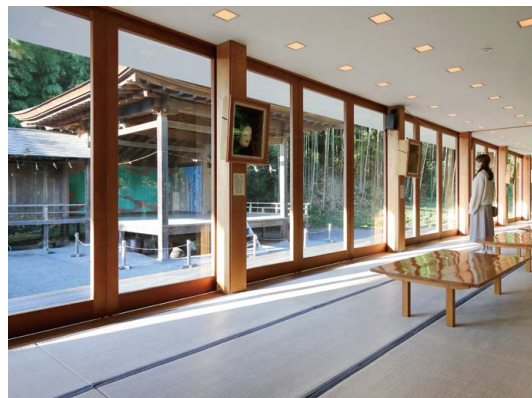
伝統芸能伝承館(森舞台)

明治21年に建てられた「旧登米高等尋常小学校」は国の重要文化財になっており、明治時代に建築された洋風建築が今も残っていることから、「みやぎの明治村」と呼ばれています。