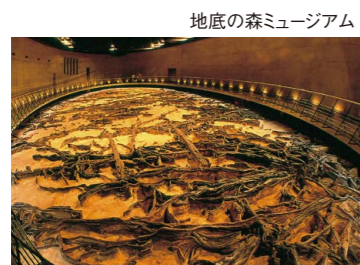
地底の森ミュージアム