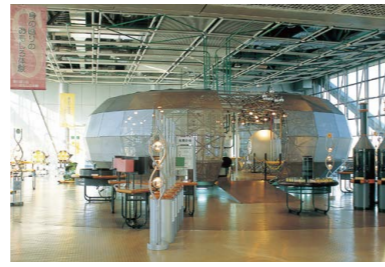
スリーエム仙台市科学館