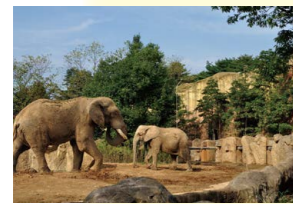
八木山動物公園フジサキの杜