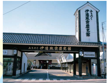
みちのく伊達政宗歴史館