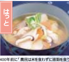
400年前に「農民は米を食わずに雑穀を食うべし」という百姓法度が出され、そこから誕生した小麦料理が「はっと」である。季節の野菜や山菜を入れた汁もの、アズキやずんだなどを絡めたりとバリエーション豊かな。 登米市