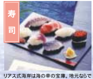
リアス式海岸は海の幸の宝庫。地元ならではの新鮮な風味を存分に。 各地