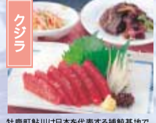
牡鹿町鮎川は日本を代表する捕鯨基地で、いまでも牡鹿半島周辺では調査捕鯨で捕獲されたカジラの料理が提供され、刺身や揚げ物などが味わえる。 石巻市牡鹿町ほか