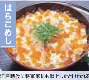
江戸時代に将軍家にも献上したといわれる阿武隈川の鮭。亶理町荒浜の漁民が政宗公に鮭と腹子のご飯を炊いて献上したところ、いたく気に入ったという。旬である秋から冬にかけて味わえる郷土料理だ。 亶理町・山元町