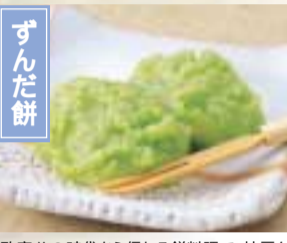
政宗公の時代から伝わる餅料理で、枝豆をすりつぶし砂糖を加え、そこに掛けた餅をからませる。県内各地で作られる伝統的な郷土料理。 仙台市