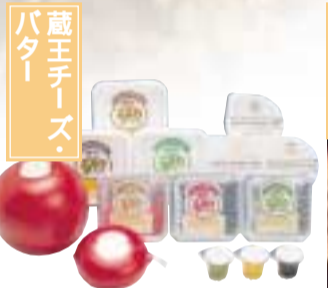
みやぎ蔵王の麓に広がる七日原高原。この高原の牧場で放牧された乳牛から作られる蔵王チーズ・バターは、敷地内の工場生産されるまさに産直品。コクのある味わいで人気が高い。 蔵王町