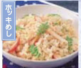
県南の沿岸で採れるホッキ貝は早春を代表する味。 亶理町・山元町