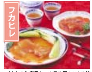
フカヒシの生産日本一の気仙沼市。市の特産品であるフカヒシは、姿寿司をはじめラーメンや茶碗蒸しなどさまざまな料理で楽しめる。 気仙沼市