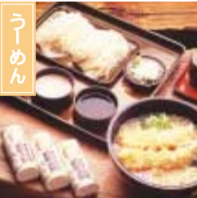
300年以上の歴史を誇る「温麺(らーめん)」は、白石和紙・小原の寒くずと並び「白石三白」と称される白石を代表する味だ。白石市内には10数軒の店があり、それぞれ自慢の味を楽しめる。 白石市