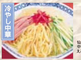
仙台発祥の名物のひとつ冷やし中華。仙台市内には一年中味わえる店が40店舗以上ある。 仙台市