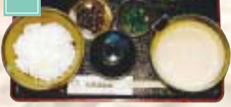
日本原産の希少な野生種の山芋。丹精こめて育てられ、糖度、味、香りともに優れている。 栗原市花山