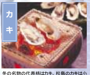
冬の名物の代表格はカキ。松島のカキは小粒で身が締まっており、味も濃いと評判。 松島町ほか