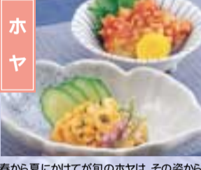
春から夏にかけて旬のホヤは、その姿から海のバイナッブルとも呼ばれている。 各地