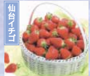
温室で栽培される仙台イチゴ。ブランドとして消費者から高い評価を得ている。 亶理町・山元町