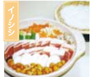
丸森町は阿武隈山系のイノシシ生息の北限の地。別名ぼたん鍋ともいわれる鍋料理やステーキ等、多種多様な料理に用いられている。 丸森町