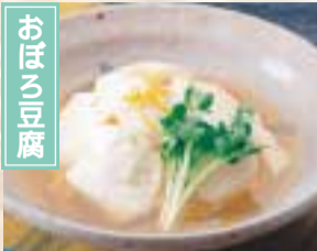
その昔、都の僧侶から町の豆腐屋が作り方を伝授されたといふおぼろ豆腐。柔らかいのが特徴で、季節の野菜や山菜などを煮込んだあんをかけていただく精進料理のひとつである。 涌谷町