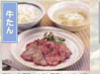
戦後の食糧難の時代に開発されたアイデア料理の牛たんは、仙台を代表する郷土料理である。定番の定食は麦めしと牛テールスープ、そして炭火で焼いた牛たん・漬物のシンプルな組み合わせで人気が高い。 仙台市