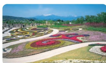
国营陆奥杜之湖畔公园(川崎町) 【国营陆奥杜之湖畔公园(川崎町)】

伊达家的重臣片仓小十郎的居城。1995年根据日本自古以来的建筑样式忠实地进行了复原。从天守阁可以将藏王群峰和市区尽收眼底。