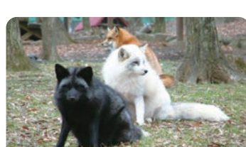
宫城藏王狐狸村(白石市) 【宫城藏王狐狸村(白石市)】

东北地区固有的乡土玩具偶人，各地有独特的形状、表情、花纹。远刈田体系偶人(藏王町)的特征是躯体上画了手、菊和梅的花纹、和蔼的表情。弥治郎体系偶人(白石市)的特征是宽阔的轳轳线和像是带了贝雷帽的头部。还有可以体验上彩的设施。