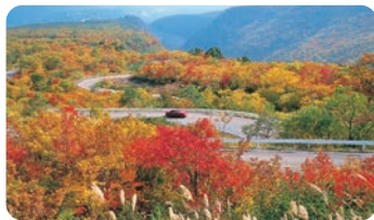
藏王回声线公路(藏王町) 【藏王回声线公路(藏王町)】

宫城藏王乌帽子滑雪场是春季赏水仙的好地方。滑雪场完全被花覆盖，4月下旬~5月中旬举办水仙节。