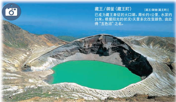
藏王/御釜(藏王町) 【藏王/御釜(藏王町)】 已成为藏王象征的火口湖。周长约1公里，水深约25米。根据阳光的状况1天内多次改变颜色，由此得“五色沼”之名。

作为仙台藩主伊达政宗的第一心腹片仓小十郎的城下町建设起来的白石。温面、和纸、木偶等自古留传下来的物产已成为特产。西有七宿，北有大河原、柴田、东有丸森等历史城镇，在藏王山麓的自然之中可以悠闲地享受温泉的乐趣。