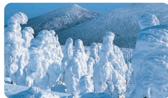
树冰(藏王町) 【树冰(藏王町)】

树冰(又名雪怪)只有在符合了生长着冷杉、地形和气象等几项条件的场所才能看到，是非常珍贵的自然艺术。在宫城藏王澄川冰雪公园可以乘坐雪车“野怪号”体验神秘的世界。