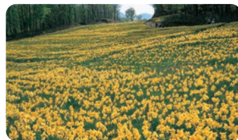
水仙节(藏王町) 【水仙节(藏王町)】

在流淌于大河原町和柴田町中央的白石川的河堤上，连绵着约8公里的樱花树。在赏花季节夜晚也用灯光照亮，樱花节等也很热闹。县内屈指可数的观赏樱花的著名景点。