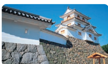
白石城(白石市) 【白石城(白石市)】

远刈田温泉(藏王町) 【远刈田温泉(藏王町)】 有2个共同浴场，作为治疗温泉很受欢迎。 镰先温泉(白石市) 【镰先温泉(白石市)】 作为奥羽的药性温泉而闻名，对外伤和神经痛有效。 小原温泉(白石市) 【小原温泉(白石市)】 眺望白石川上游风光明媚的溪谷的古老温泉。作为能够治疗眼病的温泉而远近闻名。 峨峨温泉(川崎町) 【峨峨温泉(川崎町)】 位于海拔850米的藏王山中的单楯旅馆。自古以来作为日本三大对胃肠病有效的温泉而闻名。 青根温泉(川崎町) 【青根温泉(川崎町)】 位于山间，能够放眼远望太平洋，将绝美景色尽收眼底是它的一大魅力。