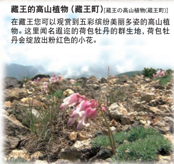
藏王的高山植物(藏王町) 【藏王的高山植物(藏王町)】 在藏王您可以观赏到五彩缤纷美丽多姿的高山植物。这里闻名遐迩的荷包牡丹的群生地，荷包牡丹会绽放出粉红色的小花。