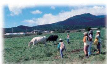
七日原高原(藏王町) 【七日原高原(藏王町)】 藏王山麓广阔的高原。有着辽阔的牧草地帯，可以欣赏牛悠然自得地吃草的情景。使用新鲜的牛奶制作的乳制品作为土特产很受欢迎。并且还可以体验挤奶和制作乳制品。