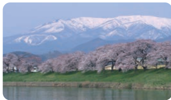
一目千株樱(大河原町、柴田町) 【一目千株樱(大河原町、柴田町)】

在流淌于大河原町和柴田町中央的白石川的河堤上，连绵着约8公里的樱花树。在赏花季节夜晚也用灯光照亮，樱花节等也很热闹。县内屈指可数的观赏樱花的著名景点。