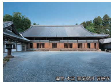
国宝・本堂

宝物館には伊達政宗公の甲冑像を中心に伊達家ゆかりのここでしか見ることができない資料を展示。歴史ある伊達文化を知る為に一度は訪れてほしい場所のひとつでもある。